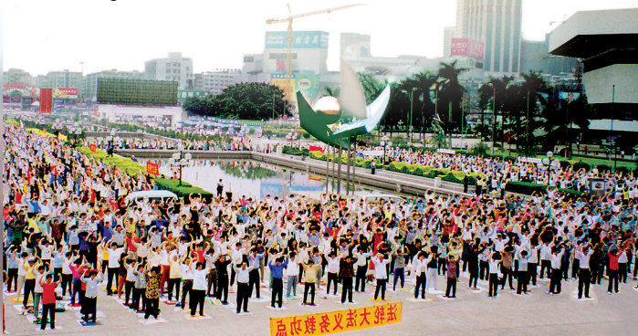
Falun Gong-övning med tusentals deltagare, som här i Guangzhou, var vanligt i Kina innan 1999.

Kinesiska kommunistpartiet med dess diktatoriska styre fruktar alla stora grupper och ser dem som ett hot mot sin maktposition. Liksom underjordiska kristna och tibetanska buddister, har miljontals Falun Dafa-utövare fråntagits den grundläggande rätten att fredligt få utöva sin tro.