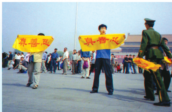
Falun Dafa-utövare håller upp tecknen Sanning, Godhet, Tålmod. För detta blir de torterade och i många fall dödade.